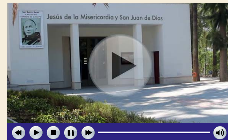
En caso de problemas para reproducir el vídeo pinche aquí

El director de enfermería destaca la profesionalidad y el trato singular que se da en la Orden Hospitalaria de San Juan de Dios y que la enmarca como un referente sociosanitario en Andalucía, ya que recientemente ha sido acreditado por la ACSA reconociendo sus modelos de atención sanitaria, en el área de salud mental, y el residencial, en las áreas de psicogeriatría y discapacidad intelectual. ■