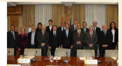
El pasado 12 de marzo quedó constituido el Foro Profesional Sanitario