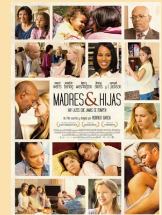
Cartel de 'Madres e hijas'

La primera edición de este ciclo se celebró con gran éxito de participación.