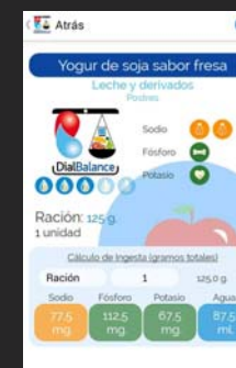
Tabla de alimentos: De una manera muy sencilla y visual, podrán consultar la cantidad de potasio, fósforo, sodio y agua contenida en los alimentos.

Gamificación o juego de salud: Los pacientes podrán jugar solos o retar a otros usuarios respondiendo preguntas sobre conocimientos asociados al contenido de agua, potasio, fósforo y sodio de los alimentos y conocimientos generales de su enfermedad.