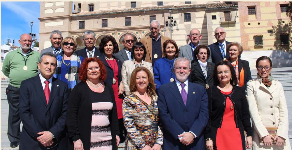
Los nuevos jubilados junto a la Junta de Gobierno, en la primera fila