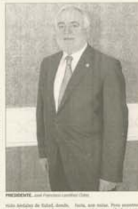
Presidente del Colegio Oficial de Enfermería de Jaén.

Comenzamos del momento que atraviesa la sanidad pública, cuando los recortes se han convertido en algo habitual, con lo que el compromiso y la profesionalidad de los enfermeros para que el sistema de salud continúe siendo de los mejores.