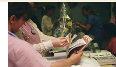
Ya se han publicado las convocatorias de oposiciones y traslados del SAS para enfermería