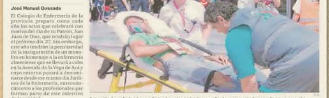
Atención de profesionales sanitarios durante un simulacro realizado como parte de su continua preparación. El acto tendrá lugar el día 27

La Vega de Acá contará con Jardines de la Enfermería, en los que se inaugurará un monolito el día 27