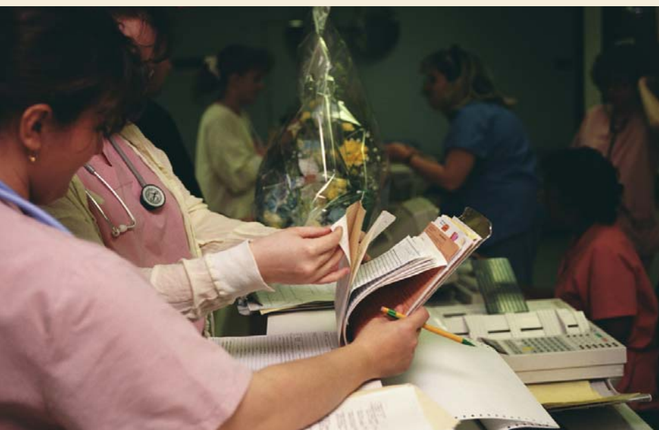
La fase de oposición constará de dos pruebas tipo test, una teórica y otra práctica

Además de las oposiciones, en el BOJA se anuncia también el concurso de traslado, con 1.323 plazas