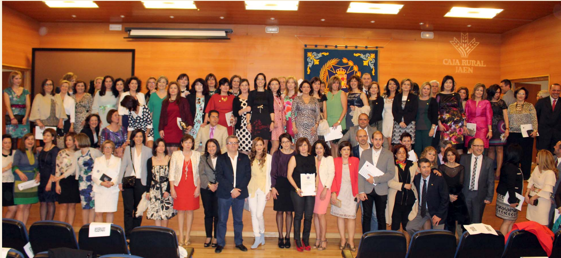
Instantánea de todos los premiados y homenajeados en la celebración del Patrón de la Enfermería, San Juan de Dios