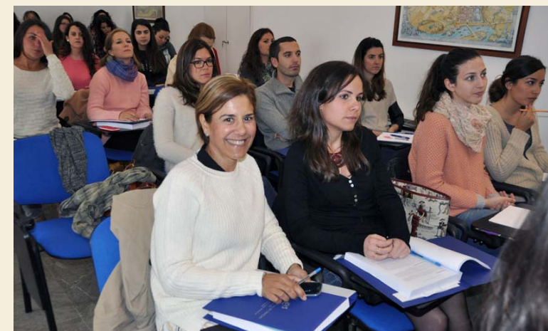
Profesionales de enfermería en un momento del curso