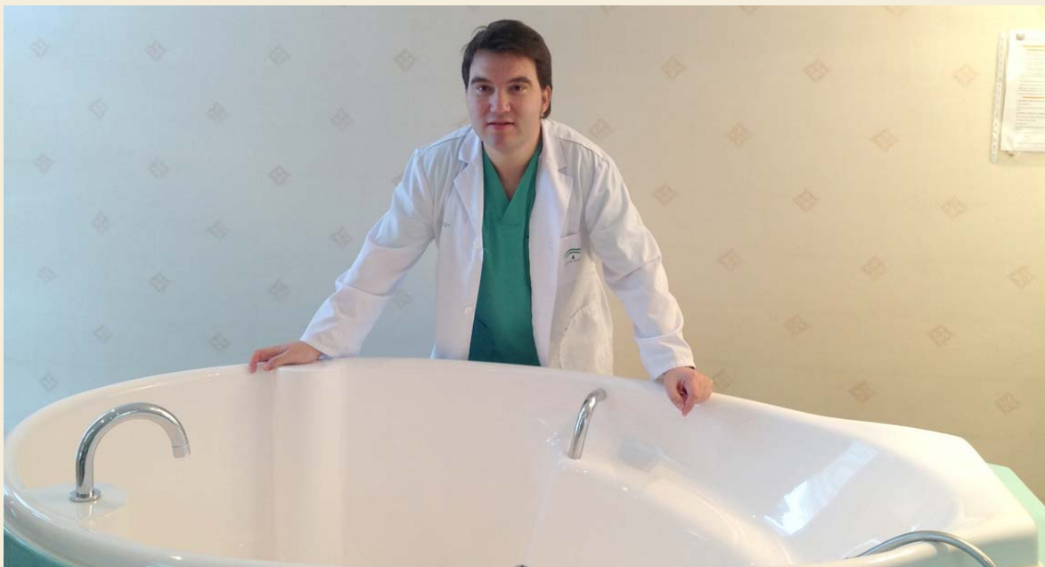
El segundo trabajo premiado del XXX Certamen pertenece a este enfermero jiennense, cuya línea de investigación trata sobre la hidroterapia como opción analgésica durante el parto