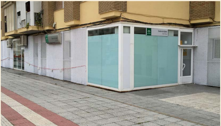
Fachada del actual centro de salud de Isla Chica, sin capacidad para una barriada de 25.000 habitantes

Tercermundista El alcalde precisó que la demanda sanitaria que soporta la citada ba-