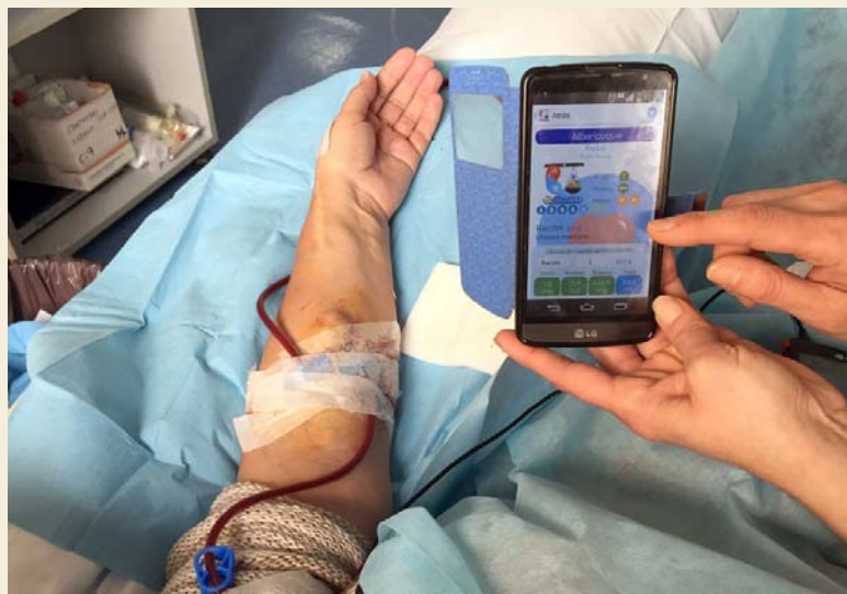
Imagen de la prueba de la aplicación con una paciente