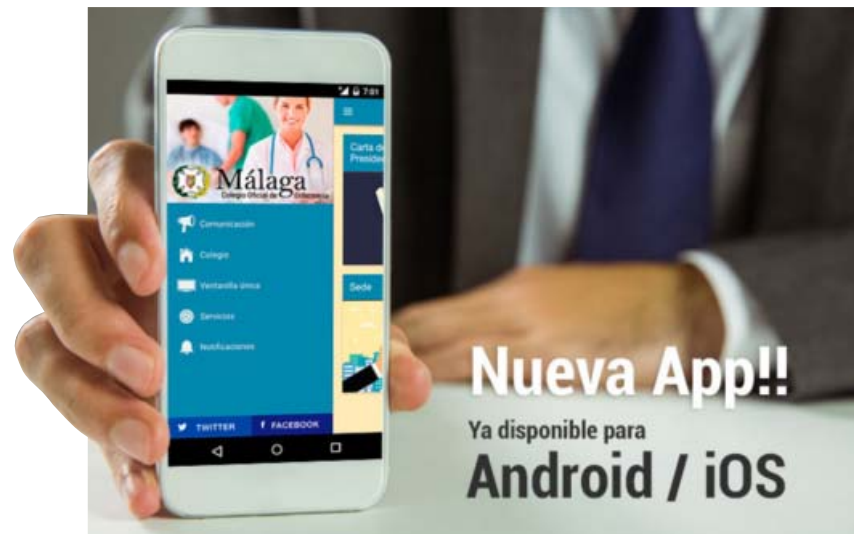
Anuncio de la aplicación para móviles COEMA

Desde hace meses se ha instaurado la nueva web colegial y la actividad en redes sociales se ha incrementado para permitir una comunicación más propia del siglo XXI