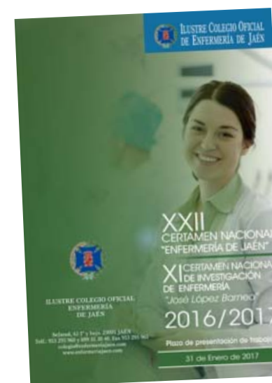
Pinche aquí para acceder al díptico que contiene las bases

Un jurado designado por el presidente de la institución colegial, junto al secretario, hará la elección de los premiados y ésta se comunicará personalmente al autor o autores. Los galardones se entregarán en un acto público haciéndolos coincidir con la celebración del patrón de la enfermería, San Juan de Dios. ■