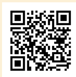
Código QR que da acceso al correo corporativo de la consulta de Ostomías