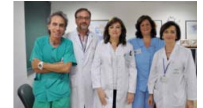
Enfermeras del Reina Sofía celebran el 40 aniversario del hospital organizando actividades