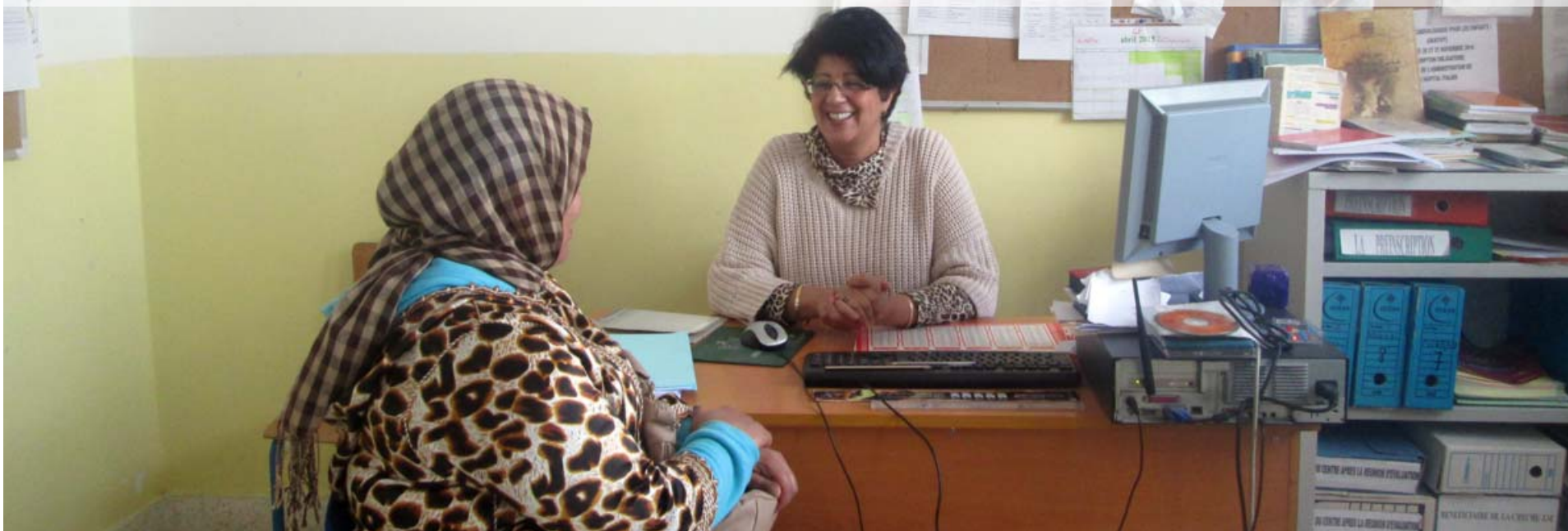
Sesión de escucha y orientación de la REC