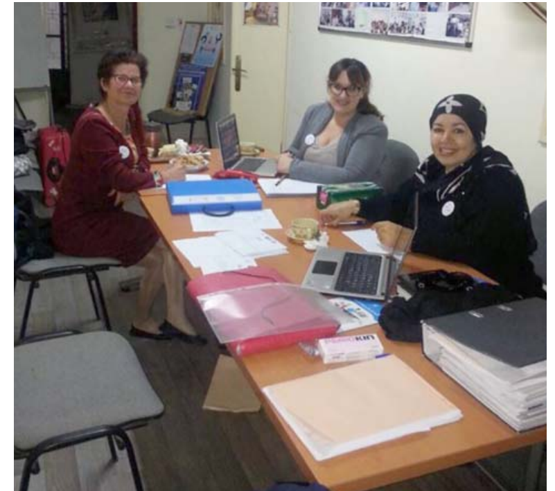
Equipo de la REC y EPM trabajando en el seguimiento del proyecto

El Ministerio de Salud tenía deficiencias a la hora de registrar en las unidades especializadas en violencia de género los casos atendidos, por lo que se creyó necesario “realizar formaciones al personal sanitario para rellenar los formularios de registro de las pacientes, enseñándoles a desagregar por sexo estos formularios introduciendo datos concretos