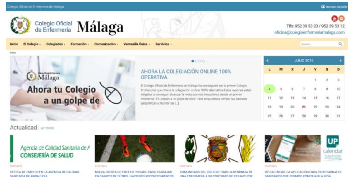
Portada de la nueva web del Colegio de Enfermería de Málaga

Una vez completados los pasos anteriores, se procederá al pago de