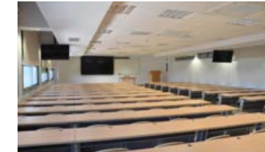
Enfermería se coloca de nuevo entre las titulaciones más demandadas por los preuniversitarios