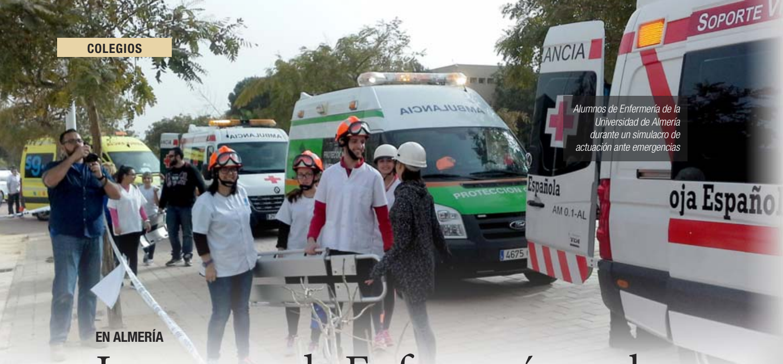
Alumnos de Enfermería de la Universidad de Almería durante un simulacro de actuación ante emergencias