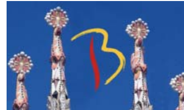
La Organización Colegial te anima a presentar tus comunicaciones en el Congreso del CIE