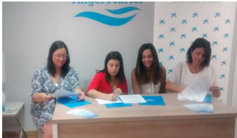
Firma del compromiso del I Premio de Enfermería en Cuidados Oncológicos Fundación Muriel

El colegio de Huelva, la Fundación Ángel Muriel, la Caixa y la Facultad de Enfermería onubense, promotores de un galardón que busca reconocer las mejores aportaciones en los cuidados al paciente de cáncer