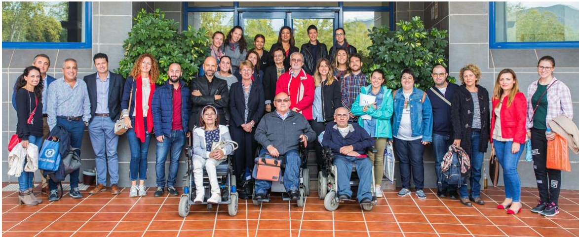
Enfermeros y pacientes al término de las Jornadas