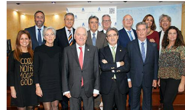
Toma posesión la nueva Junta de Gobierno del Colegio de Cádiz