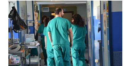
El CAE, con las reivindicaciones de los enfermeros de Salud Mental