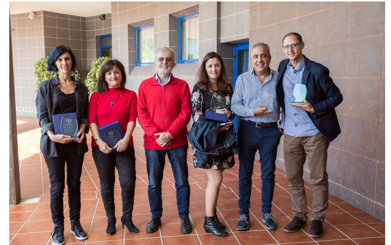
Los enfermeros conferenciantes junto al presidente