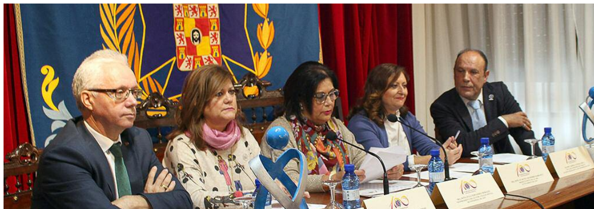
Autoridades presentes en la inauguración de la actividad formativa