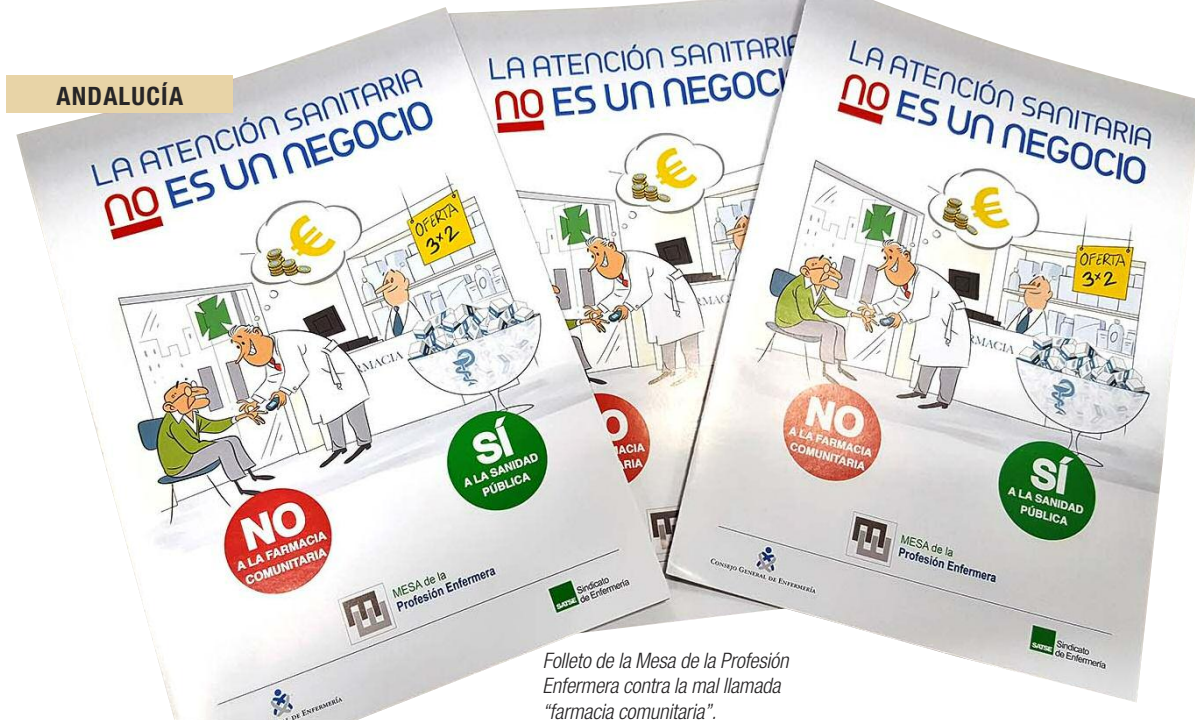
Folleto de la Mesa de la Profesión Enfermera contra la mal llamada "farmacia comunitaria".