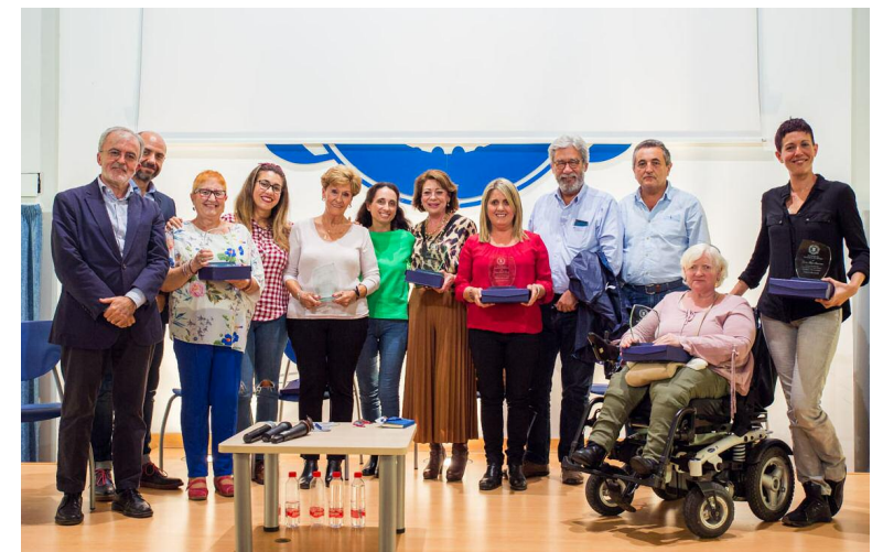
Mesa de pacientes con la Junta de Gobierno