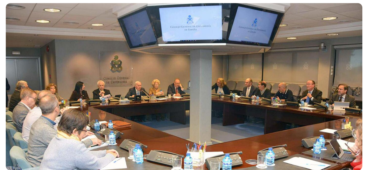
Pleno del Consejo General de Enfermería.

La Mesa de la Profesión informa de que la "farmacia comunitaria" no está reconocida como especialidad y, por tanto, no está regulada por ninguna norma, decreto o ley, apuntan. Por el contrario, las enfermeras y enfermeros y médicos, desde la independencia y sin intereses económicos de ningún tipo, ejercen y garantizan una atención sanitaria pública de calidad, tanto en el centro de salud como en los domicilios, y una asistencia totalmente adecuada a las necesidades de cada momento vital de las personas, explican en el folleto tanto el Consejo General de Enfermería como el Sindicato de Enfermería, SATSE. ■