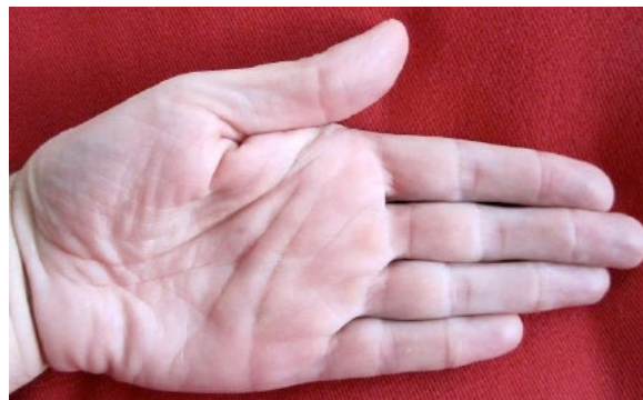
Fig. 2. Regra da palma da man