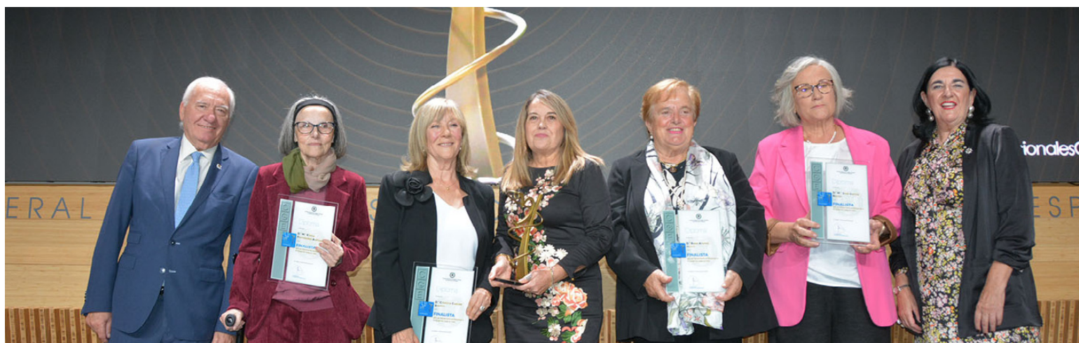
Foto de grupo de los finalistas de la categoría Trayectoria Profesional