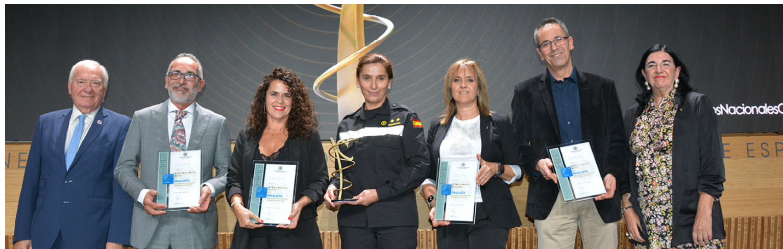
Ganadora y finalistas de la categoría "Ámbito asistencial"