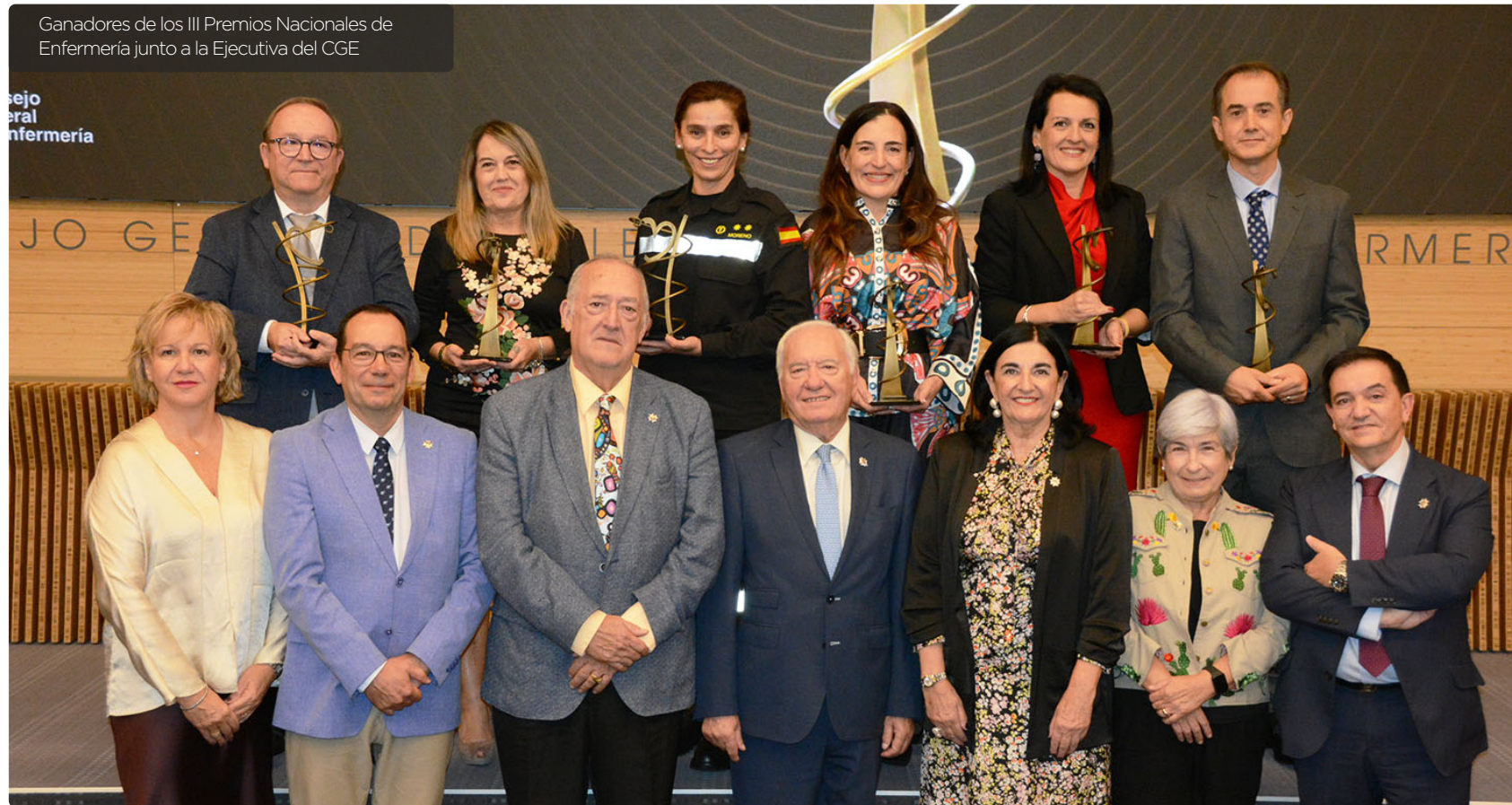
Ganadores de los III Premios Nacionales de Enfermería junto a la Ejecutiva del CGE

Consejo General, en el que la profesión se reúne para reconocer y aplaudir la labor de cinco grandes compañeros y compañeras. Y no solo la suya, sino también la de los otros 20 finalistas y el resto de candidatos, que este año han llegado hasta un centenar. Tenemos que valorar el altísimo nivel que ha habido en esta gala y este es el ejemplo de los enormes profesionales que tenemos en España. De hecho, ellos son solo una representación de la formación y preparación que tienen las más de 353.000 enfermeras y enfermeros de nuestro país”, afirmó Florentino Pérez Raya, presidente del CGE.