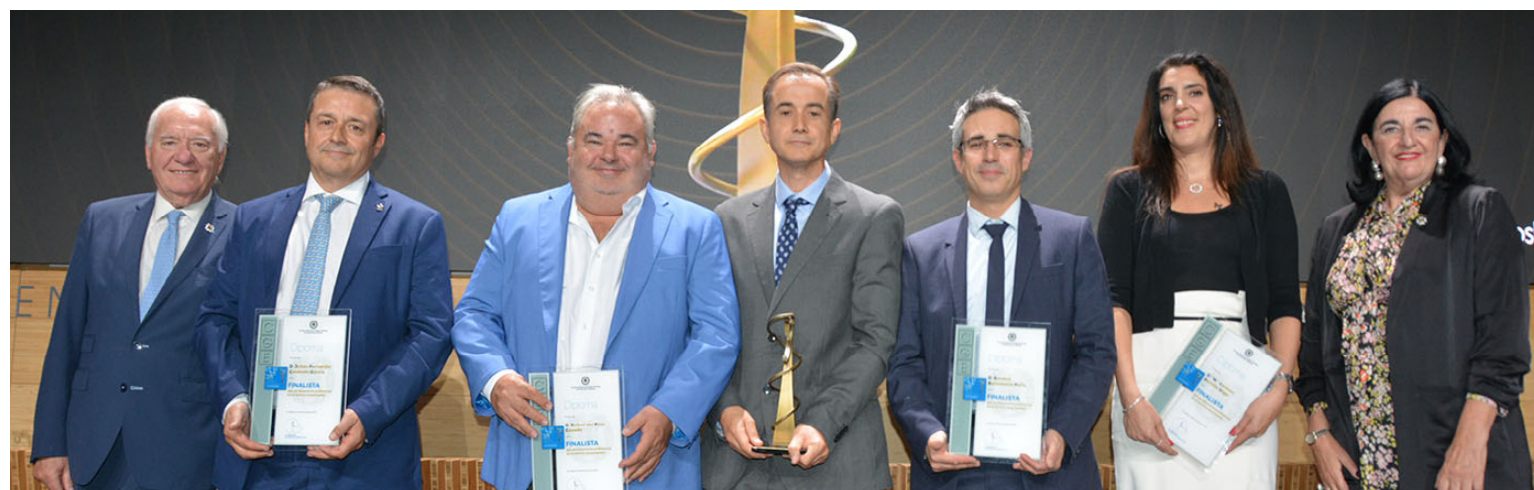
Ganador y finalistas de la categoría "ámbito investigador"