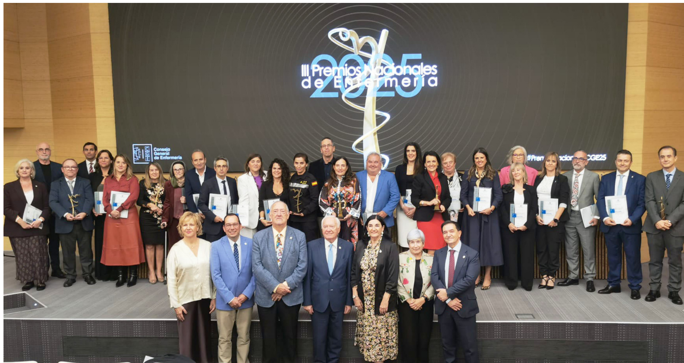
Foto de familia de ganadores y finalistas de los III Premios Nacionales de Enfermería