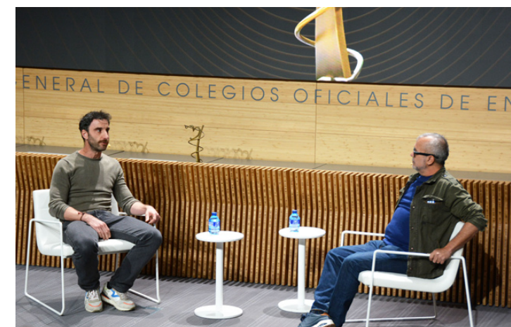
Un momento del espectáculo de improvisación de Dani Rovira y Arturo González Campos