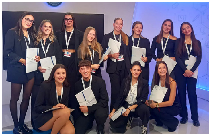
Estudiantes de la Universidad Europea y Universidad Autónoma de Madrid participaron en la organización