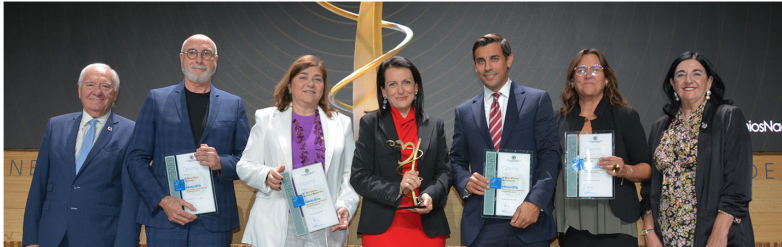
Ganadora y finalistas de la categoría "ámbito gestor"