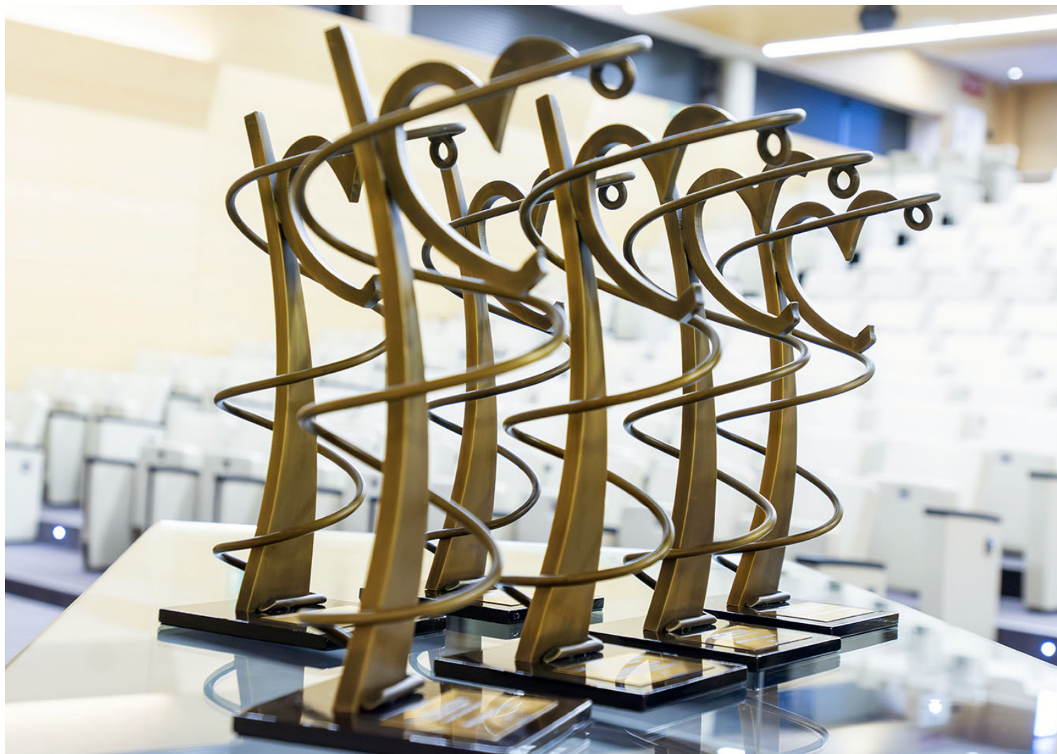
Trofeos de los III Premios Nacionales de Enfermería