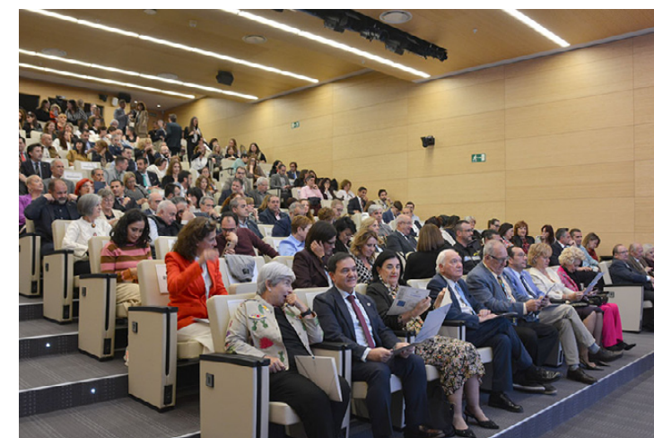
Dos horas en las que se puso de relieve la importancia de la profesión