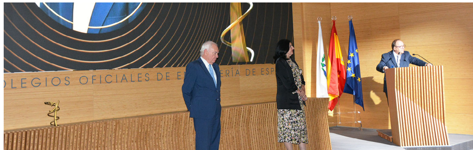
El ganador en la categoría de Persona ajena a la profesión, durante su discurso de agradecimiento