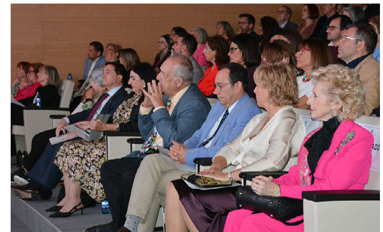
Más de 250 personas acudieron a la gala