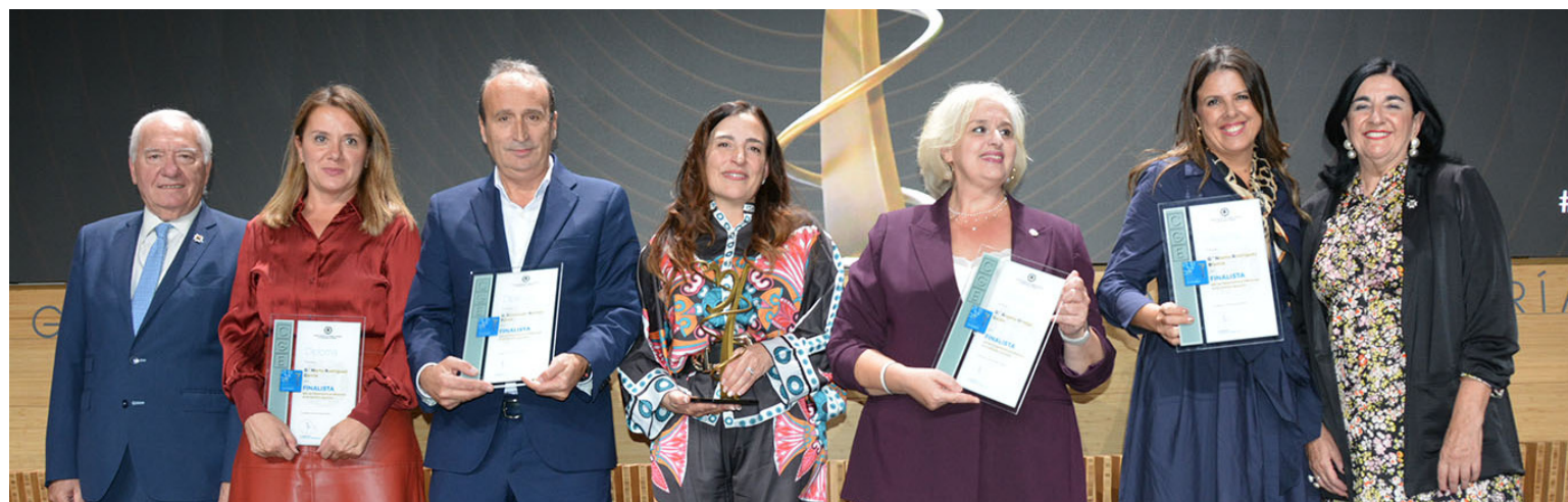
Ganadora y finalistas de la categoría "ambito docente"