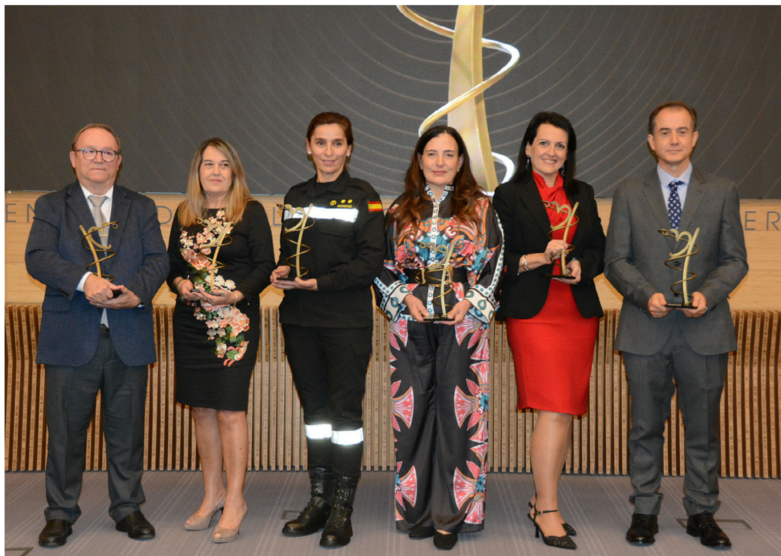
Ganadores de los III Premios Nacionales de Enfermería