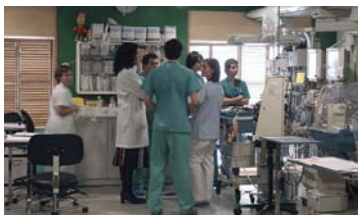
La Mesa Estatal de la Profesión Enfermera y Sanidad firman un acuerdo histórico

6 PORTADA Enfermería y Ministerio, comprometidos con el Sistema Nacional de Salud