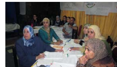
EPM mantiene su compromiso con los ODM 4, 5 y 6 sobre mortalidad materno-infantil

28 OCIO Y CULTURA Antoni Tàpies hace arte de lo cotidiano