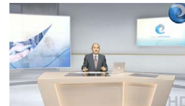
Resumen de los contenidos de la edición número 8 de Diario Enfermero TV

16 DIARIO ENFERMERO TV Todos los contenidos de la edición número 8