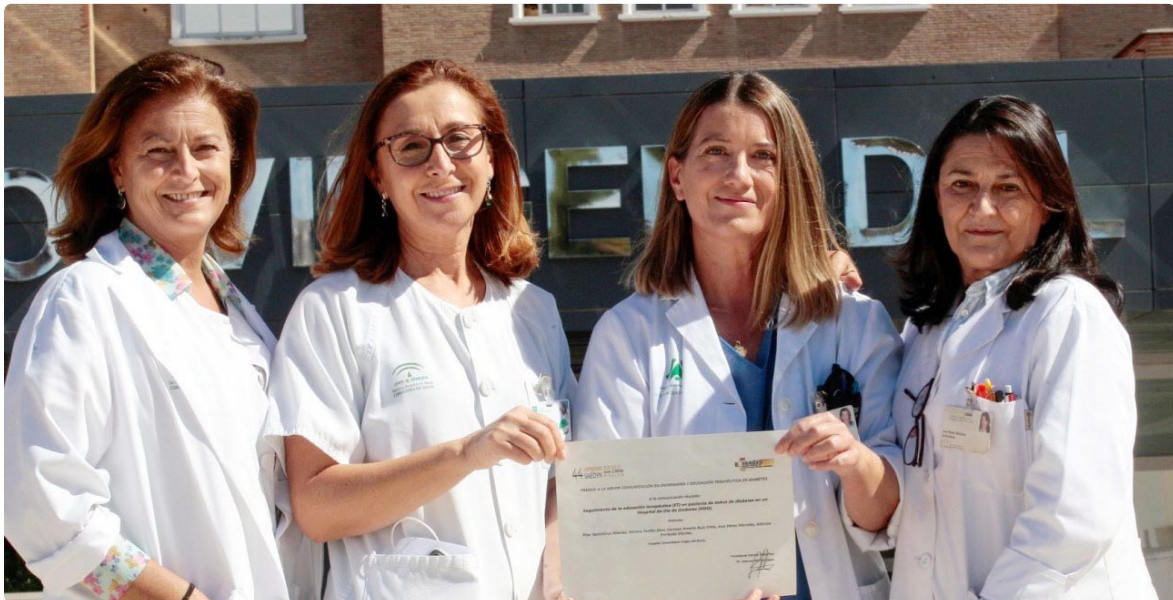
Las enfermeras ganadoras del Premio en el 44 Congreso de la SAEDYN

Las cinco enfermeras han reflejado la educación terapéutica estructurada que ofrecen a pacientes en el debut de su enfermedad en el Hospital de Día de Diabetes