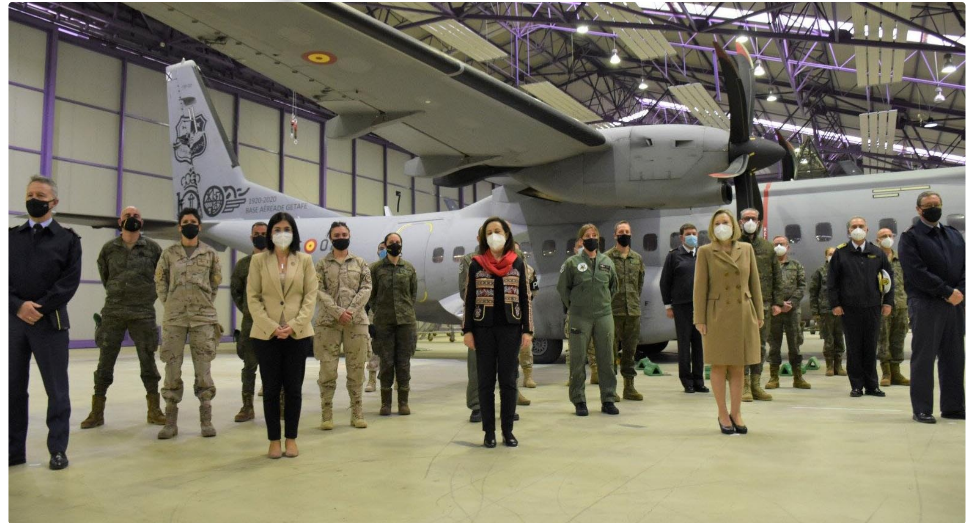
Visita de la ministra de Sanidad, Carolina Darias, a la base aérea de Getafe (Madrid)

Así, el Ministerio asignó 50 equipos de vacunación móviles para Andalucía; cinco para Aragón; uno para el Principado de Asturias; 10 para