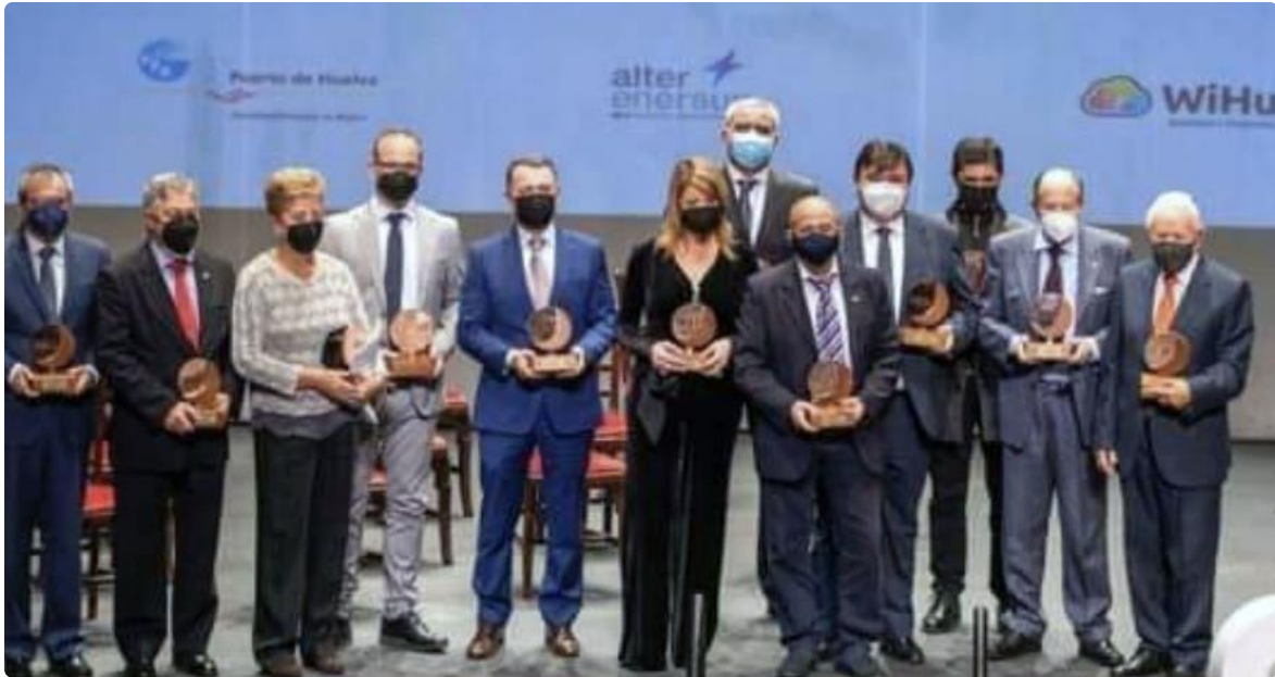
Reconocidos en el acto. Por su parte, el presidente del Colegio recogió el galardón