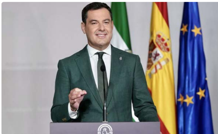
Presidente de la Junta de Andalucía, Juan Manuel Moreno

A día de hoy, como viene denunciando este Consejo, Andalucía cuenta con un déficit alarmante de sanitarios que impide atender de manera adecuada las necesidades derivadas del incremento de la incidencia del COVID-19 así como la campaña de vacunación, tanto para la administración de la dosis de refuerzo como la vacunación infantil. “Los datos arrojados por el presidente difieren de la realidad a la que nos enfrentamos día a día los profesionales de enfermería en nuestros puestos de trabajo. Unas cifras que no cuadran con el cierre por las tardes de los centros de salud, ni las instrucciones emitidas por la Junta