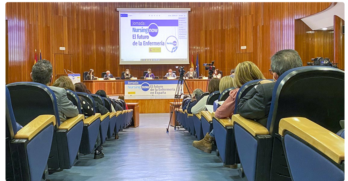
La jornada se pudo seguir en streaming y de forma presencial

Además de adaptar la plaza de enfermeras a las ratios que actualmente tiene Andalucía, logrando los estándares de calidad que desde la Unión Europea se establece como necesario para la seguridad y calidad asistencial ofrecida al paciente. En definitiva, mayor reconocimiento, liderazgo y oportunidades de desarrollo en todos los niveles de enfermería. “Se hace necesario implicar a las Administraciones para que conozcan aquellos ámbitos dónde la enfermería puede tener un mayor impacto, qué impide que las enfermeras alcancen todo su potencial y cómo abordar estos obstáculos” ha concluido. ■