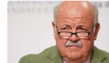
El consejero de Salud y Familias, Jesús Aguirre, responde a la carta emitida por el CAE