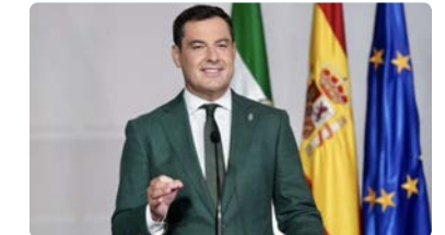
Posicionamiento de las enfermeras andaluzas ante las declaraciones de Juan Manuel Moreno, presidente de la Junta