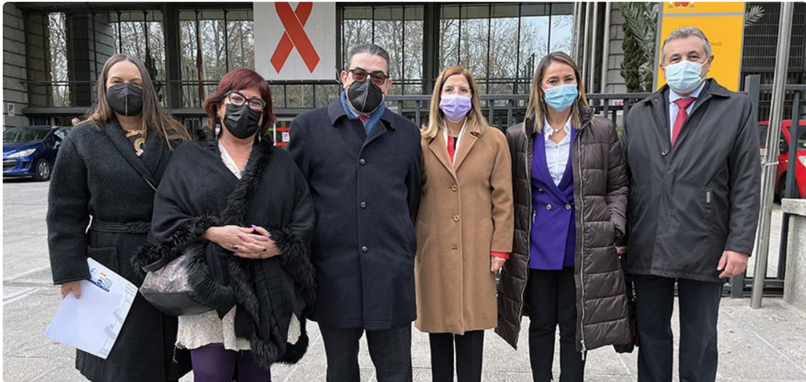
Representantes de la enfermería andaluza en el acto de clausura Nursing Now