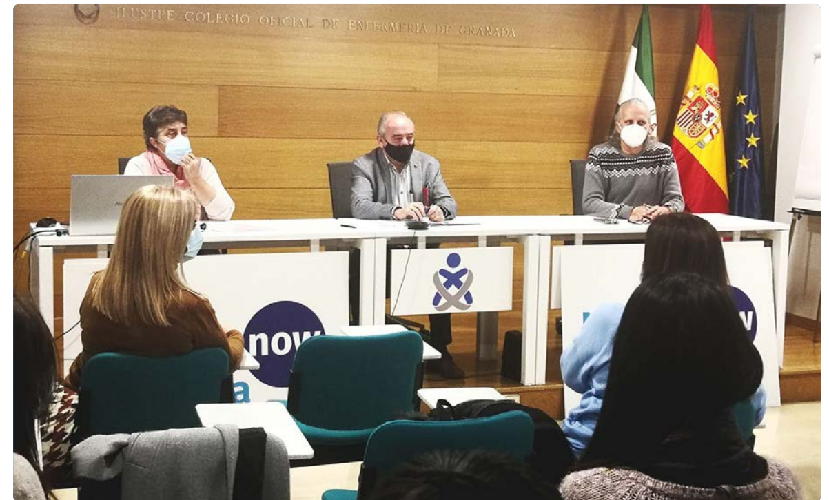
La Junta de Gobierno del Colegio de Granada hace balance del año 2021