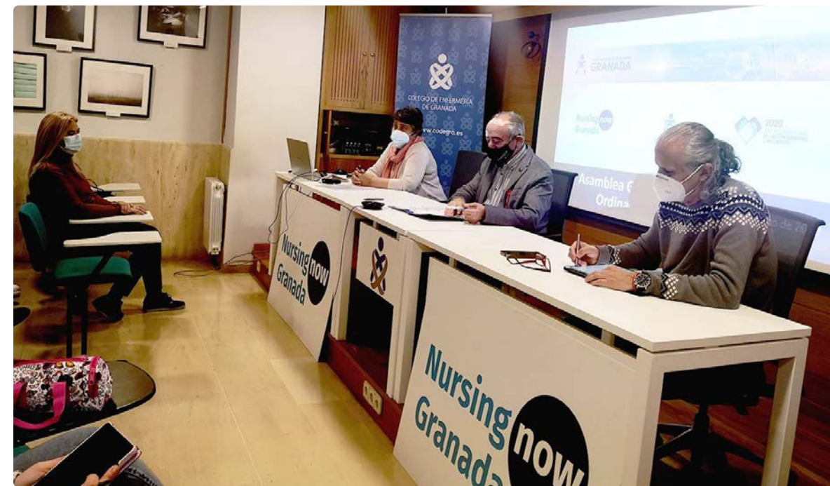
Representantes del colectivo sanitario en la celebración de la Junta General

“La profesión requiere un compromiso para estabilizar las planti-