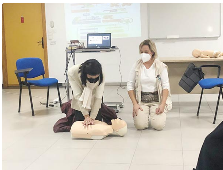
Un momento de las explicaciones

El Colegio Oficial de Enfermería de Córdoba continúa animando a todos los profesionales enfermeros de la provincia a sumarse a esta iniciativa, para la que tan solo es necesario motivación para ser parte del cambio y disponer de un poco de tiempo para acciones de voluntariado. Los enfermeros interesados pueden informarse en el email cordoba@solidaridadenfermera.org o en el teléfono del colegio cordobés 957 29 75 44. ■