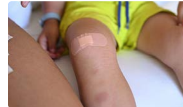
¿Es segura la vuelta al Colegio sin enfermeras escolares?