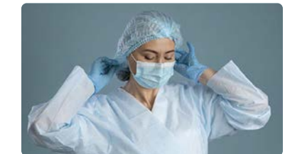
El CAE recuerda que la denominación de enfermería debe cuidarse