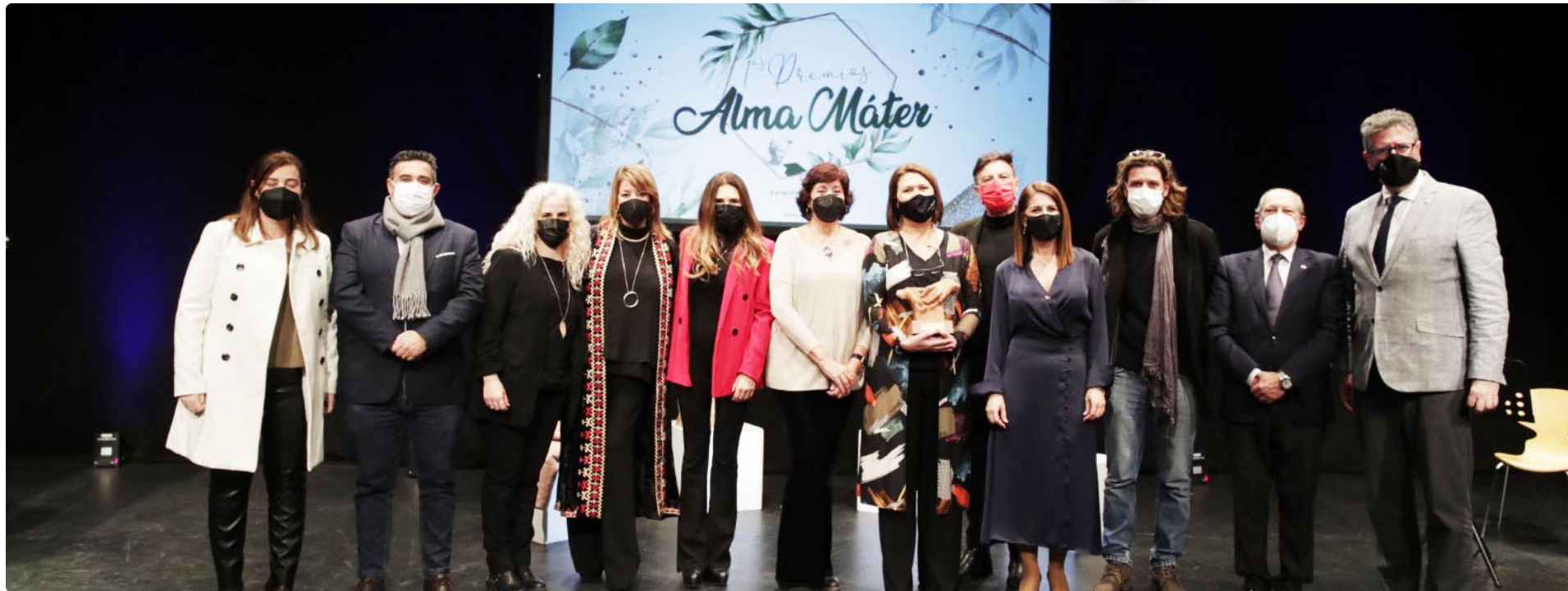
Fotografías del acto de entrega del I Premio "Alma Mater Creando Puentes"