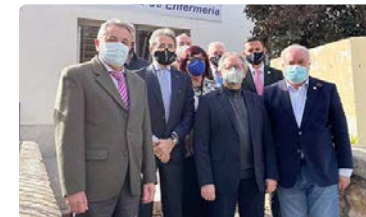
Las enfermeras andaluzas, comprometidas con la investigación