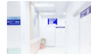
Reunión de trabajo para mejorar los cuidados ofrecidos en Atención Primaria