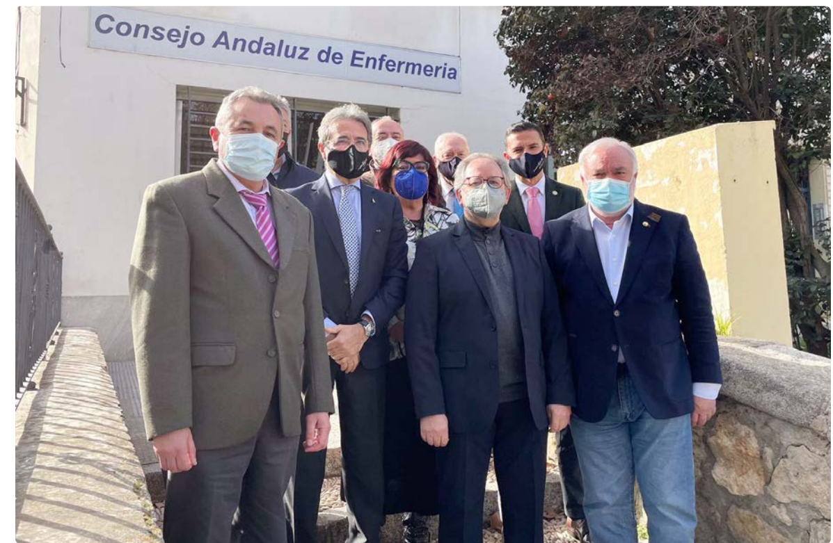
Representantes varios durante la firma del convenio con la Fundación INDEX

La Fundación Index es una entidad científica de reconocido prestigio internacional que, desde los años 80, viene trabajando en la gestión del conocimiento enfermero, desarrollando líneas y grupos de investigación, generando bases de datos bibliográficas, realizando actividades formativas y, en definitiva, promoviendo la investigación científica orientada a la enfermería y al componente cultural de los cuidados y la humanización de la salud. ■