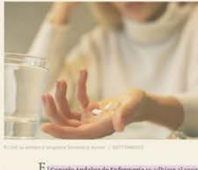
El Consejo Andaluz de Enfermería se adhiere al programa 'Benzostop'