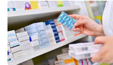
Andalucía implementa un nuevo proyecto de educación sanitaria sobre el uso de tranquilizantes