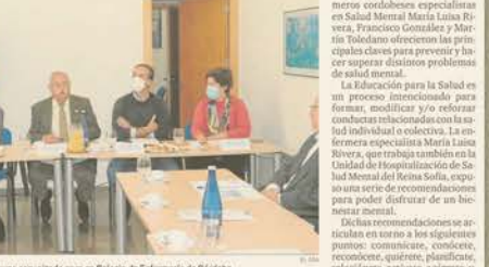
Profesionales sanitarios en el desayuno organizado ayer en Colegio de Enfermería de Córdoba.