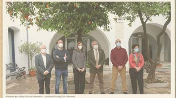
El 68,3% de los cordobeses está preocupado por los problemas de salud mental. El que más...

Onda Cero Córdoba Córdoba | 24.03.2022 19:35