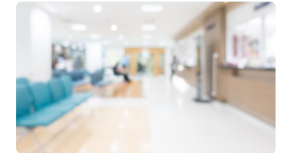
Rechazo del CAE a las convocatorias de cargos intermedios del SAS