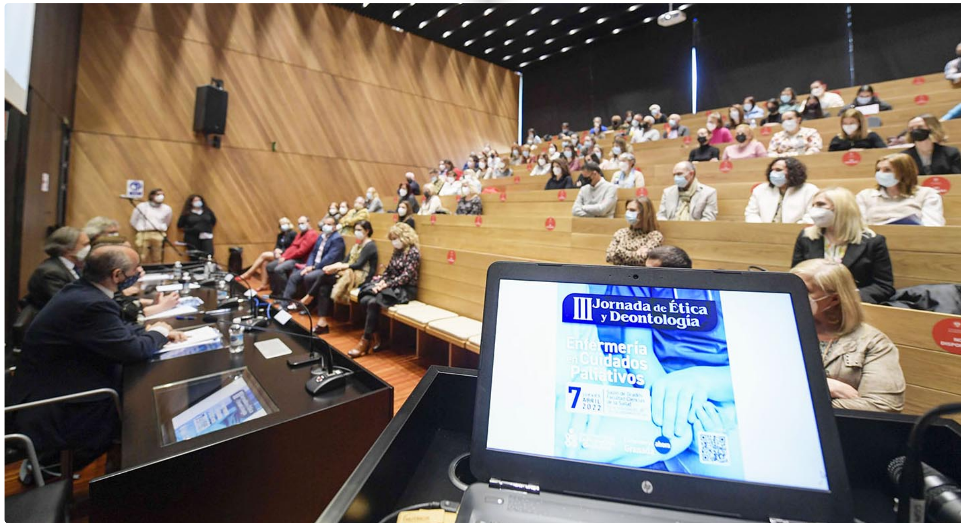
Fotografía tomada durante la celebración de las III Jornadas de Ética y Deontología

El Colegio de Enfermería de Granada mantiene su apuesta por la ética y la deontología con cursos de formación especializada, un ciclo de cine que aprovecha la filmografía nacional y extranjera para abordar temas conflictivos y un servicio de asesoramiento, entre otras propuestas. ■