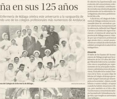
Miembros del Colegio de Enfermería de Málaga.