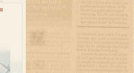
Profesionales sanitarios en el desayuno organizado ayer en Colegio de Enfermería de Córdoba.