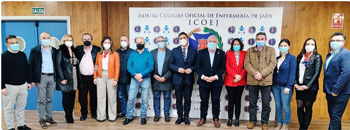
Miembros del jurado del Certamen Nacional de Investigación formado por responsables de centros sanitarios, responsables de formación de Atención Primaria y Especializada, de la Universidad de Jaén y la UNED