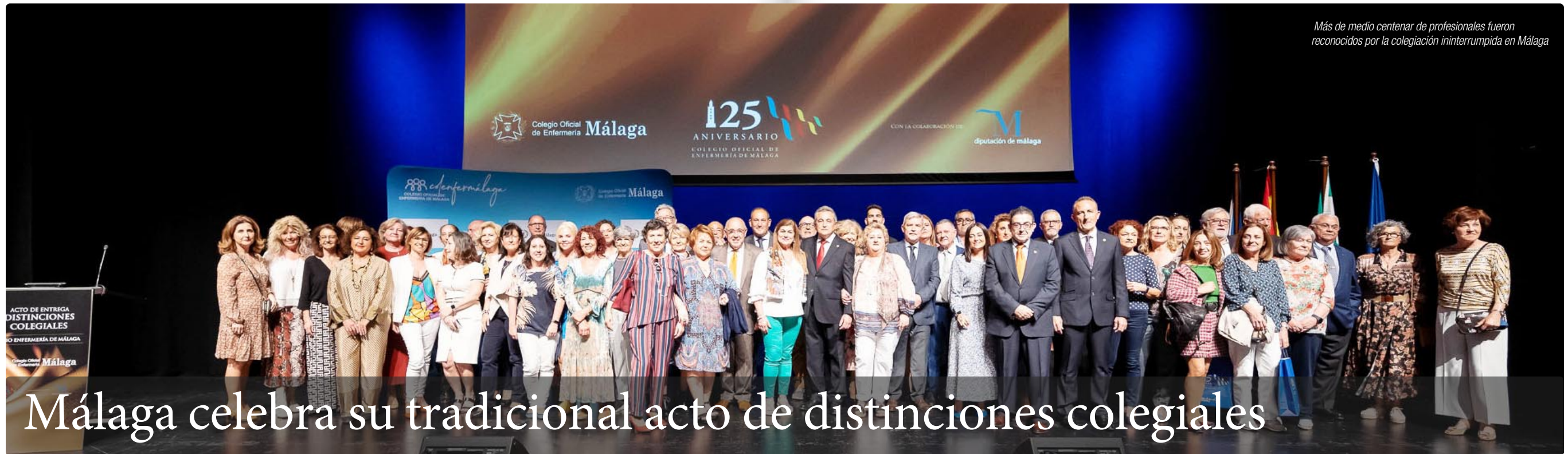
Más de medio centenar de profesionales fueron reconocidos por la colegiación ininterrumpida en Málaga