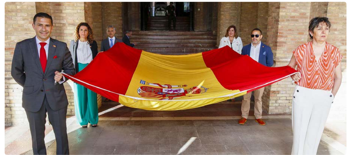
Algunos de los miembros de la Junta de Gobierno del ECOES portando la bandera para su posterior izado en el Cuartel General Fuerza Terrestre del Ejército de Tierra