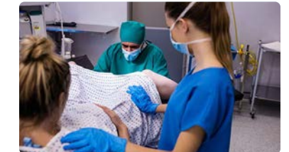
Rechazo del CAE a las convocatorias de cargos intermedios del SAS