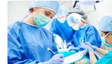
Andalucía implementa un nuevo proyecto de educación sanitaria sobre el uso de tranquilizantes