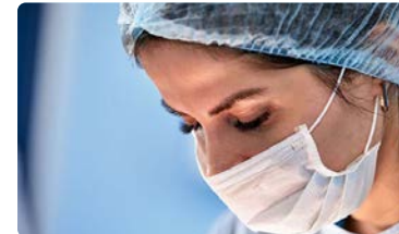
La profesión dice NO a la FP Sociosanitaria propuesta por el Gobierno