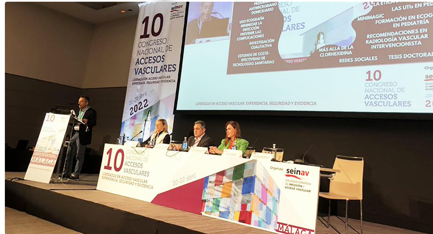
Mesa de clausura del 10º Congreso Nacional de Accesos Vasculares en la que participa el presidente del CAE

Antequera. “La idea de implementar esta iniciativa surge aproximadamente hace cuatro años bajo el objetivo de mejorar las competencias enfermeras y promover la educación sanitaria del paciente. Desde el ámbito asistencial identificamos una carencia en el manejo de los dispositivos venosos. En concreto,