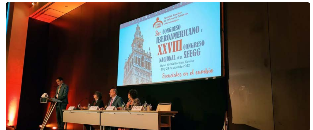
Fotografía tomada durante el acto de clausura del Congreso