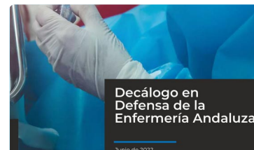
¿Cuáles son las principales reivindicaciones de la profesión enfermera en Andalucía?