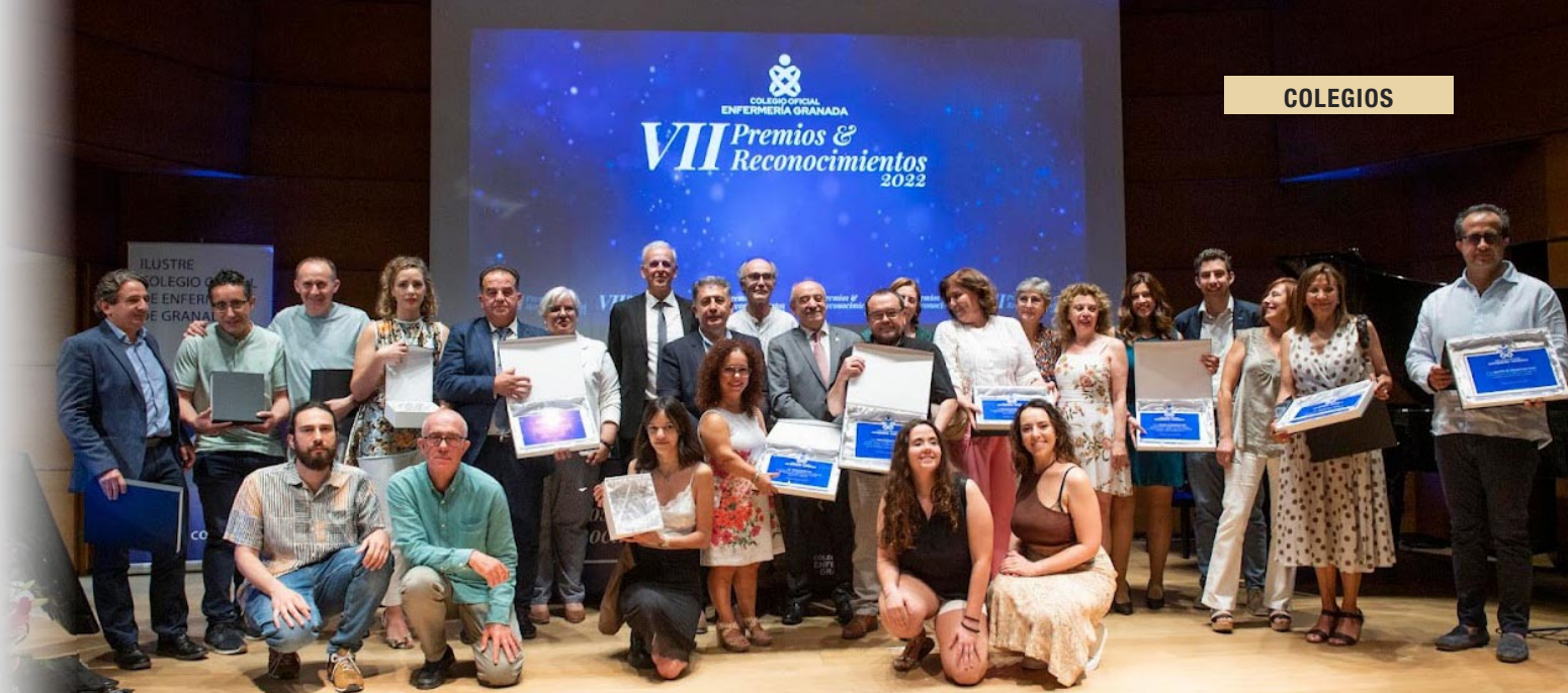
Foto de familia de todos los premiados y representantes institucionales

De toda la labor que desarrollan Carrión y su equipo destaca el economato socio-educativo que se ha convertido en alma de ALFA. Este