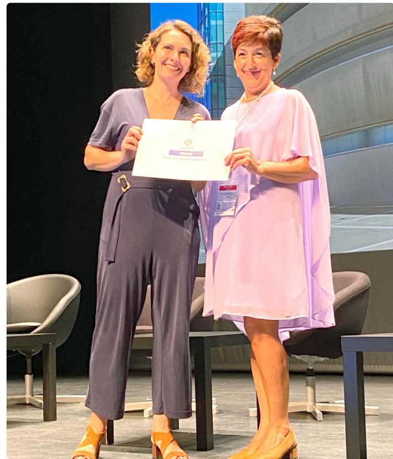
Entrega de premios en la clausura del XI Congreso ASANEC

“Los profesionales sanitarios, desde el día que terminan la carrera y se incorporan al sector, adquieren