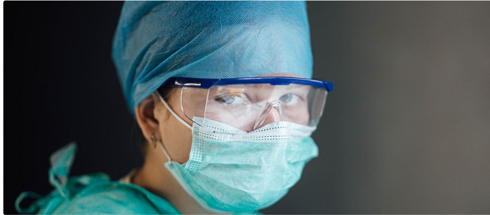
Enfermera desarrollando su trabajo en centro hospitalario

En esta línea, el CAE demanda un incremento en las plazas EIR de Enfermería Familiar y Comunitaria para la conformación de un profesional muy cualificado ante una sociedad con nuevas y complejas necesidades en salud. A su vez, también es necesaria una apuesta decidida por el establecimiento y refuerzo de los nuevos roles enfermeros en AP: Enfermera Gestora de