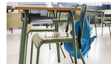
La enfermera escolar, necesaria en los centros educativos de Andalucía