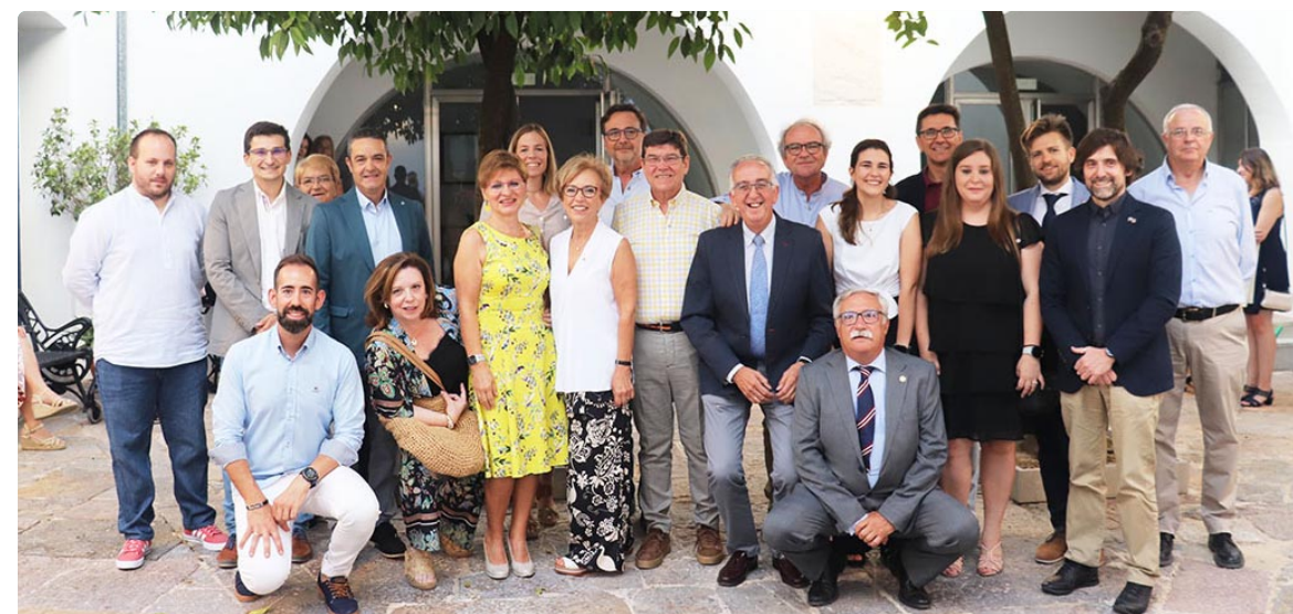
Reconocimiento a los Doctores de Enfermería cordobeses, celebrado en la sede del colegio cordobés

Estas 550 investigaciones han generado 8.604 citas a nivel mun-