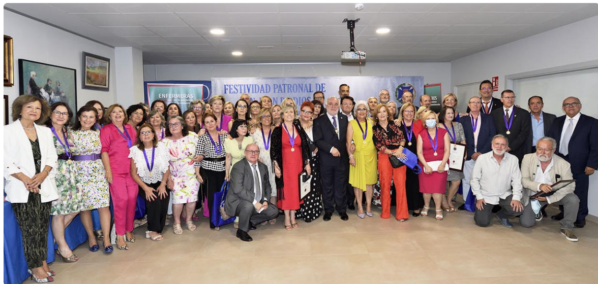
Grupo de compañeros y compañeras homenajeados en su jubilación.