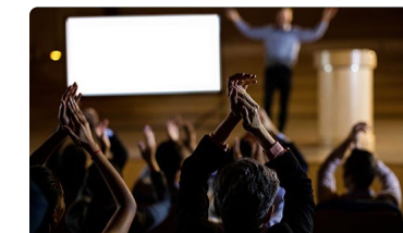
Toda la actualidad enfermera de los últimos congresos celebrados en Andalucía