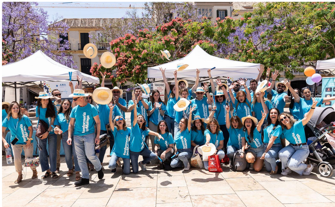
Profesionales de Enfermería y residentes que participaron en el I Bazar del Cuidado Enfermero