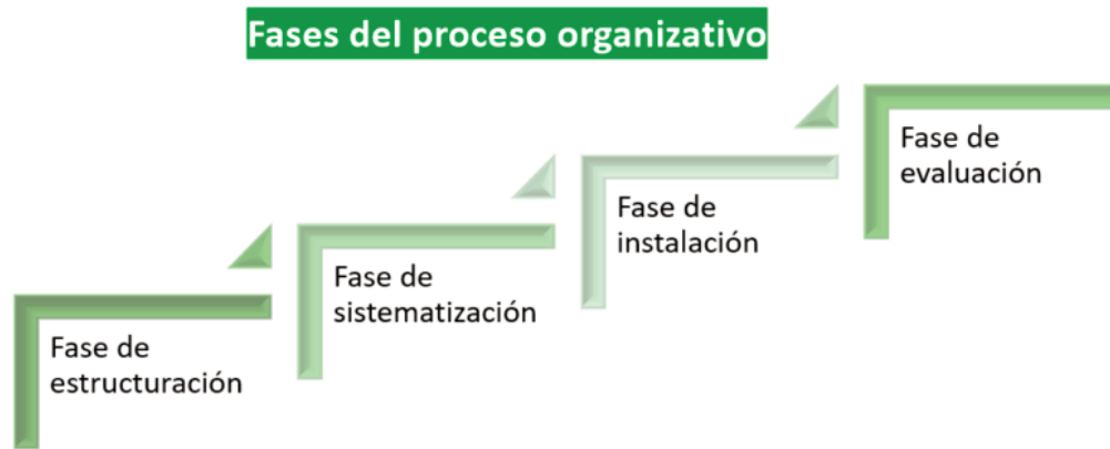
Figura 2. Fases del proceso organizativo. Elaboración propia.

Estas fases se expresan ordenadas de forma lógica, aunque cabe señalar que, en la práctica profesional, enfermeras y enfermeros gestores las realizan diferenciada o simultáneamente en la medida del tipo y momento en el que se encuentra su responsabilidad organizativa. En muchas ocasiones, la experiencia del profesional hace que algunas de ellas no se identifiquen de forma explícita, sino que se produzcan con tanta naturalidad que parezcan un continuo inseparable. No obstante, es deseable que si se va a iniciar desde