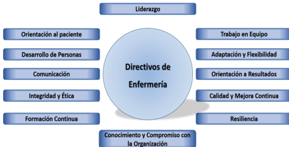
Figura 3. Competencias que deben poseer los directivos en el área de la Salud según la sociedad Española de Directivos de la Salud. Elaboración propia.

En general para la mayor parte de enfermeras y enfermeros que componen equipos directivos y más concretamente para todos los mandos intermedios (supervisoras, coordinadoras, jefes de equipo, área, subdirectoras, equipos de staff, profesionales de referencia, etc.) que tienen o conforman equipos operativos a su cargo, la dirección de personas es un reto continuo que exige importante conocimiento, voluntad y trabajo pero que, si se le presta la atención precisa, una gran parte de los resultados se tornan satisfactorios y por ello se convierten en si mismos, en un estímulo que retroalimenta la continuidad de los esfuerzos realizados.