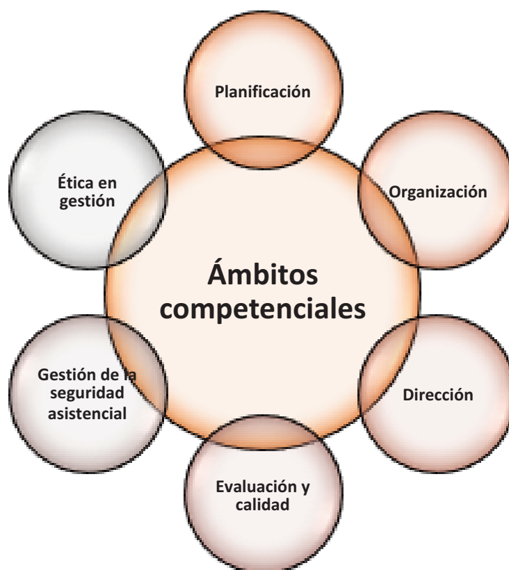
Figura 1. Ámbitos competenciales de desarrollo para las enfermeras gestoras y líderes en salud. Elaboración propia.

Por ende, una gran mayoría de enfermeras de todo el mundo han trabajado sin descanso en unas condiciones terriblemente estresantes, desbordadas por la presión y circunstancias propias de la pandemia SARS-CoV2 y no solo han tenido que responder adaptando inmediatamente su práctica cuidadora a ello, sino que en lo que a enfermeras gestoras se refiere, ellas y ellos han tenido que reorganizar toda su actividad, recursos materiales, conocimiento, tiempos y equipos humanos y materiales adaptándolos a la crítica realidad. Han tenido